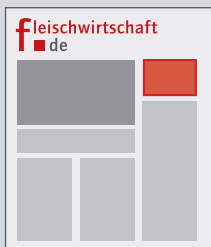
fleischwirtschaft.de Homepage Aufmacher Bühne