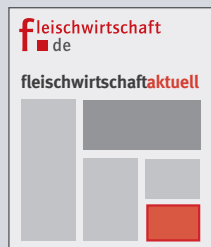
fleischwirtschaft.de Homepage Aktuell Bühne