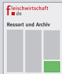
fleischwirtschaft.de Ressort und Archiv